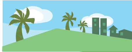
ตัวอย่างภาพที่สร้างจากสีวรรณะเย็น