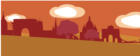
ตัวอย่างภาพที่สร้างจากสีวรรณะอุ่น

การวาดภาพโดยใช้วรรณะของสี อันดับแรกเราต้องรู้ก่อนว่าจะวาดภาพอะไร ให้ความรู้สึกอย่างไร เช่น ภาพทะเลทราย พระอาทิตย์ กองไฟ ฤดูใบไม้ร่วง ก็ควรจะใช้สีวรรณะอุ่น หากเป็นภาพ วิวทะเล สวนดอกไม้ ต้นไม้ ฟุ้งหญ้า บ้านสวน ภาพบรรยากาศตอนเย็น ควรจะใช้สีวรรณะเย็น