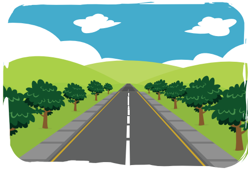
ตัวอย่างภาพที่มีการใช้ระยะ

การจัดระยะในภาพเป็นสิ่งสำคัญเพราะทำให้รูปภาพดูแล้วไม่แบน ทำให้เกิดความรู้สึกมีวัตถุที่อยู่ใกล้และอยู่ไกล วัตถุที่อยู่ไกลออกไปจะดูเล็กและเลือนรางไม่ค่อยชัดเจน ส่วนวัตถุที่อยู่ใกล้จะมีขนาดใหญ่และชัดเจนกว่า การร่างภาพให้เกิดระยะจึงต้องอาศัยหลักของ Perspective คือการเขียนภาพให้ปรากฏออกมาในลักษณะที่เหมือนการมองเห็นจริง