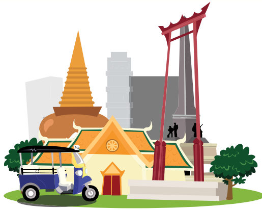
ตัวอย่างการวาดภาพด้วยน้ำหมึกสี