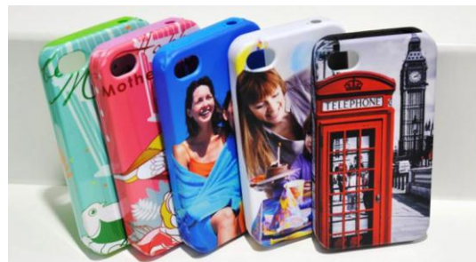
ตัวอย่างภาพพิมพ์