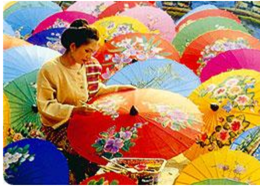
ร่มบ่อสร้าง