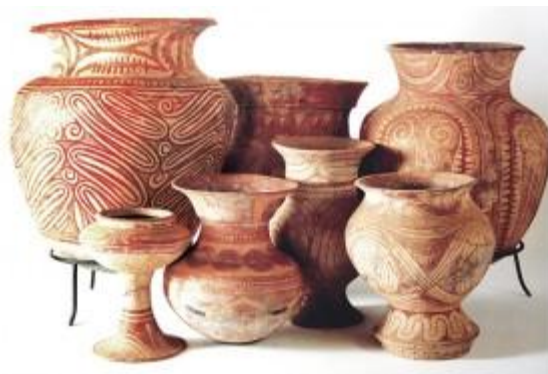
เครื่องปั้นดินเผาบ้านเชียง จ.อุดรธานี

ภาคอีสาน เป็นที่ราบสูงมีสภาพภูมิอากาศแบบร้อนชื้นสลับแห้ง ทำให้อาจเจอผลกระทบจากความแห้งแล้งเป็นส่วนมาก ผลงานศิลปะส่วนใหญ่จะเกี่ยวข้องกับการดำรงชีวิต เช่น การตกแต่งบั้งไฟเพื่อใช้แห่ขอฝนตามความเชื่อโบราณ การทำเครื่องจักรสาน เช่น กระจูดข้าว การทำเครื่องปั้นดินเผาเพื่อเอาไว้เก็บน้ำ เป็นต้น