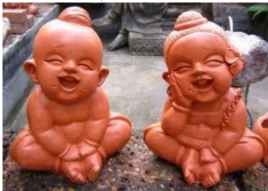
ตุ๊กตาดินเผา

ภาคกลางเป็นศูนย์กลางความเจริญ ทำให้มีความหลากหลายทางศิลปะและวัฒนธรรมมากกว่าภาคอื่นๆ งานศิลปะของภาคกลาง ได้แก่ การละเล่นพื้นบ้าน เช่น ลำตัด ลิเก การสร้างบ้านเรือนไทย ตุ๊กตาดินเผา เป็นต้น