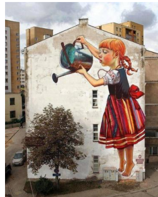
ตัวอย่างงานจิตรกรรม