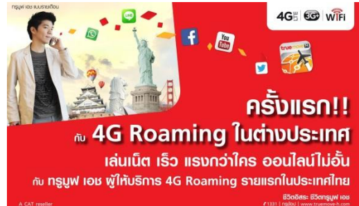
ตัวอย่างสื่อผสมหรือสื่อมัลติมีเดีย

แหล่งการเรียนรู้สื่อผสมหรือสื่อมัลติมีเดีย เช่น เว็บไซต์ต่างๆ ทวี อินเทอร์เน็ต เป็นต้น