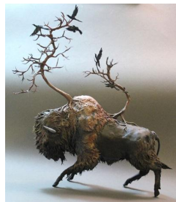
ตัวอย่างงานประติมากรรม