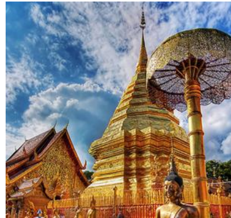
ตัวอย่างงานสถาปัตยกรรม