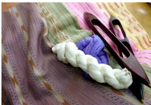
เครื่องมือทอผ้าไหม

ทัศนศิลป์กับอุปกรณ์ในการประกอบอาชีพ อาชีพและการทำมาหากินอยู่คู่กับชุมชน และสังคมมาโดยตลอดและอีกหนทางหนึ่งที่จะช่วยทุ่นแรงในการสร้างอาชีพได้นั้นก็คือการคิดหาอุปกรณ์ช่วยในการทำงาน ช่วยเพิ่มประสิทธิภาพและช่วยลดระยะเวลานั้นเอง