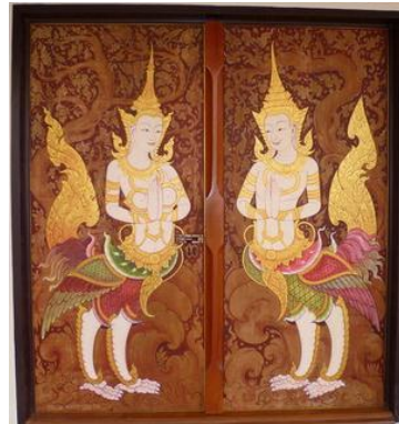
ที่มา : http://www.cmadong.com/board/index.php?topic=941.0 http://maimuangallery.blogspot.com/2012/05/blog-post.html

ประติมากรรมกับศาสนา เป็นการแสดงออกด้วยการปั้น การแกะสลัก โดยจะมีลักษณะเป็น 3 มิติ เช่น รูปปั้นพระพุทธรูป การแกะสลักลวดลายบนบานประตูหน้าต่าง